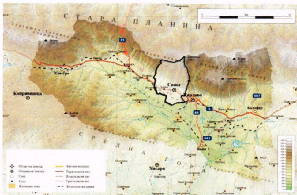
Фиг. 2. Географска карта на региона в, който е разположена община Сопот

Сопотската котловина се огражда от север от най – високата част на Стара Планина – Троянска и Калоферска планина. Общата площ на котловината възлиза на около 56 кв. км.